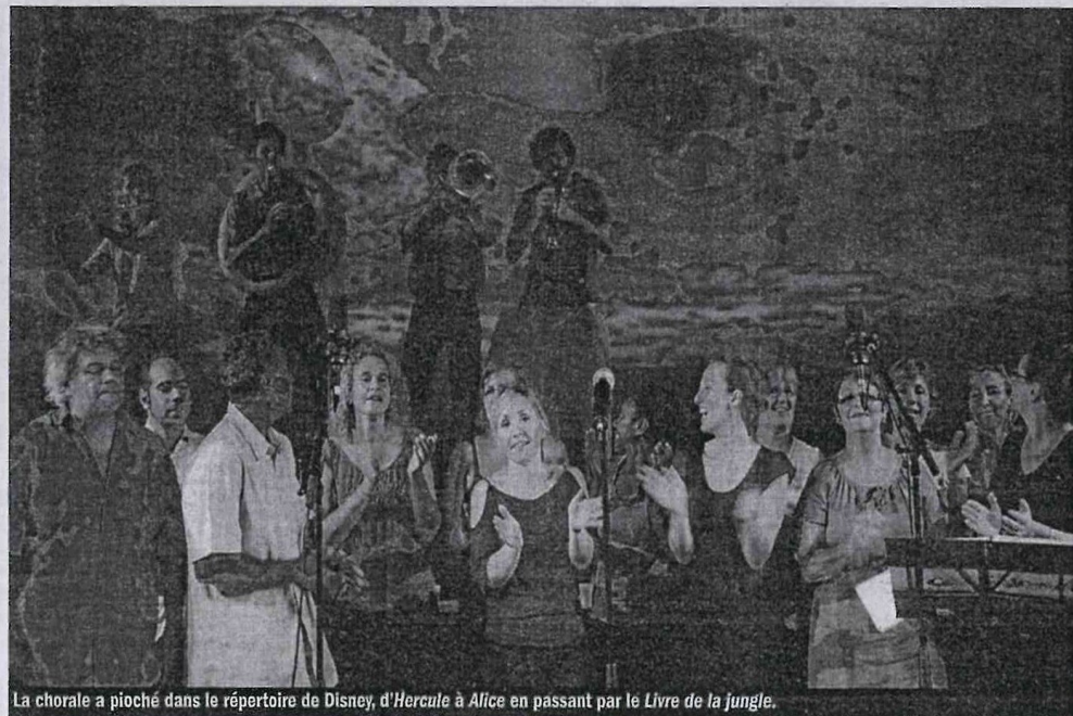
La chorale a pioché dans le répertoire de Disney, d' Hercule à Alice en passant par Le Livre de la jungle .